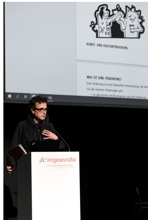
Vortrag auf der Angewandten